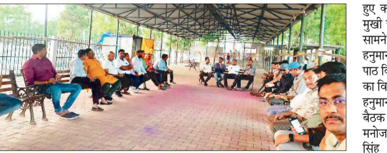
बैठक में रुपरेखा तैयार करते आयोजन समिति के पदाधिकारी।

श्री रामनवमी जन्मोत्सव समिति के द्वारा भीमा तालाब स्थित शनि मंदिर प्रांगण में श्री राम जन्मोत्सव शोभायात्रा की अंतिम रूपरेखा हेतु शनिवार 14 मार्च को बैठक रखी गई। श्री राम जन्म महोत्सव 26 मार्च को उत्साह पूर्वक मनाया जाएगा। नैला रेलवे स्टेशन के पास गणगौर मंदिर के पीछे स्थित श्री राम मंदिर से शोभायात्रा प्रारंभ होगी। इस पैदल शोभा यात्रा में नगर एवं आसपास के ग्राम के महिला, पुरुष, बालवृंद पारंपरिक वेशभूषा में शामिल होंगे।