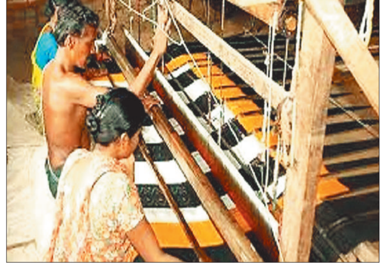
बुनकरों का कार्य में जुटे श्रमिक।

गौरतलब है कि कोसे के कारीगरी के लिए देश में मशहूर जिले के बुनकरों को शासन की कई कल्याणकारी योजनाओं का लाभ नहीं मिल पा रहा है। जिले के बुनकर योजनाओं का लाभ पाने के लिए पंजीयन तो करा ले रहे हैं, लेकिन विभागीय अधिकारियों कर्मचारियों की उदासीनता के चलते पात्र हितग्राहियों को योजनाओं का लाभ नहीं मिल पा रहा है। वहीं ग्रामोद्योग विभाग का कामकाज महज पंजीयन करने तक ही सिमटकर रह गया है। जिले में पंजीकृत बुनकरों की संख्या 3 हजार से अधिक है। शासन की योजनाओं के तहत बुनकरों को कोट पालने की व्यवस्था, धागा उपलब्ध कराना, उपकरण सहित अन्य व्यवस्था बनाने का काम विभाग के माध्यम से किया जाना रहता है वहीं बुनकर समितियों की संख्या 80 है, लेकिन विभागीय अधिकारी कर्मचारियों की उदासीनता के चलते पंजीकृत बुनकरों को शासन की योजनाओं का लाभ नहीं मिल पा रहा है। जिले के चाम्पा क्षेत्र कोसे के कारोबार के लिए देश में मशहूर है वहीं चाम्पा शहर से बना कोसे का कपड़ा अमेरिका, रूस, जापान, समेत भारत के बैंगलोर, चेन्नई, अमरावती, सूरत, पुणे, मुंबई, दिल्ली समेत अन्य क्षेत्रों में जाता है।