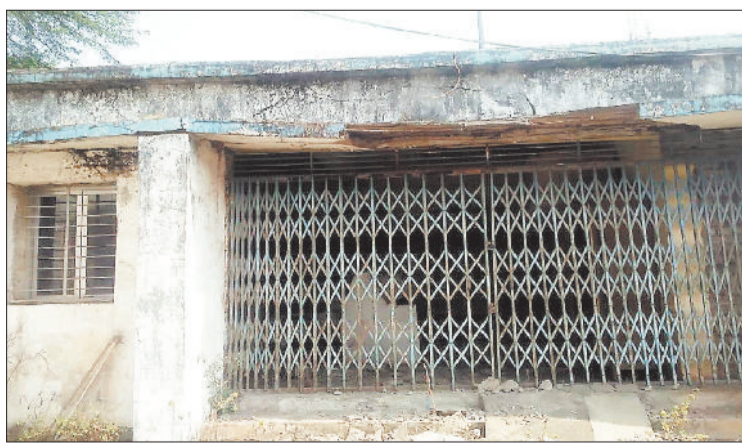
देखरेख के अभाव में खंडहर में तब्दील हो रहा भवन।