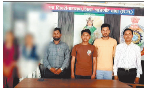
पुलिस गिरफ्त में आए बिना अनुमति प्रार्थना सभा कराने वाले छह सदस्य।

हुआ। सूचना पर पहुंची पुलिस ने बिना अनुमति प्रार्थना सभा आयोजित करने वालों के विरुद्ध कार्रवाई की। शिवरीनारायण थाना क्षेत्र अंतर्गत ग्राम खरौद के तिवारीपारा में रविवार 15 मार्च को प्रार्थना सभा आयोजित की जा रही थी। रमाशंकर