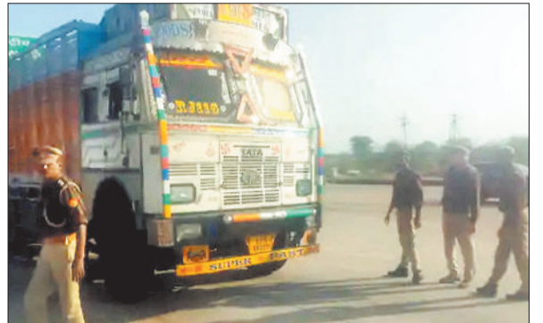
वाहनों की जांच करती पुलिस टीम।

भारी वाहनों में हेलपर नहीं रखने से बढ़ रहे सड़क हादसों को देखते हुए पुलिस ने सख्त रुख अपना लिया है। दो दिन का विशेष अभियान चलाकर 153 ट्रेलर, हाइवा, ट्रक व अन्य बड़े वाहनों पर कार्रवाई की गई है। जिले में लगातार हो रही सड़क दुर्घटना पुलिस प्रशासन के लिए परेशानी का सबब बन गई है। ज्यादातर भारी वाहनों की चपेट में आकर लोगों की मौत हो रही है। सड़क दुर्घटनाओं की रोकथाम एवं आमजन की सुरक्षा को ध्यान में रखते हुए जिले भर में दो दिवसीय विशेष जांच अभियान चलाया गया। इस अभियान के तहत ट्रेलर, हाइवा, ट्रक सहित अन्य भारी वाहनों की सघन जांच की गई। अकलतरा एवं एच, जांजगीर एवं अन्य राजमार्ग बलौदा, मुलमुला क्षेत्र में पुलिस द्वारा कैप लगाकर बड़े वाहनों में हेलपर नहीं रखने वाले 153 वाहनों को पकड़ा गया। सभी वाहन चालकों के विरुद्ध नियमानुसार मोटरवाहन अधिनियम के तहत